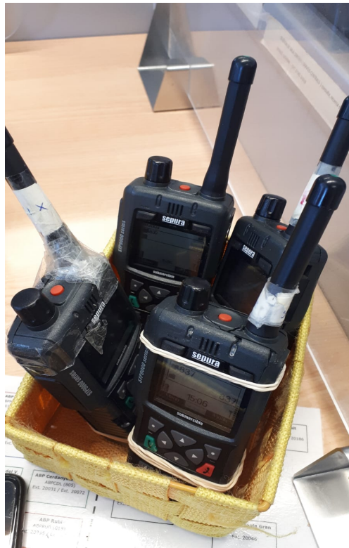
Fotografia de detall “Caixa de portàtils” que l’operador/a porta al seu torn