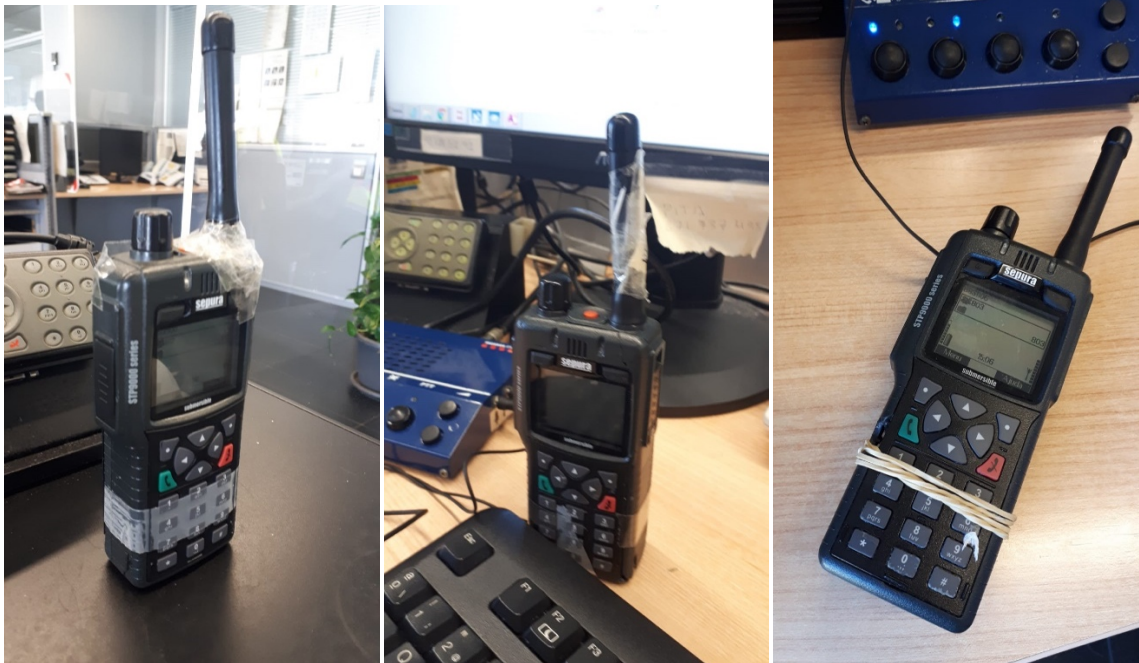
Fotografia de detall dels portàtils que substitueixen a les emissors fixes. Un operador/a porta una conferència (emissora fixa) i un o dos portàtils per altres conferències que s’unifiquen. TOTAL: UNA PERSONA TRES CONFERÈNCIES