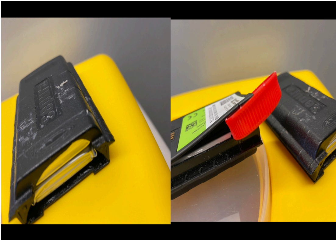
Fotografia de detall per poder veure l'estat de les bateries dels portàtils i el risc que comporta