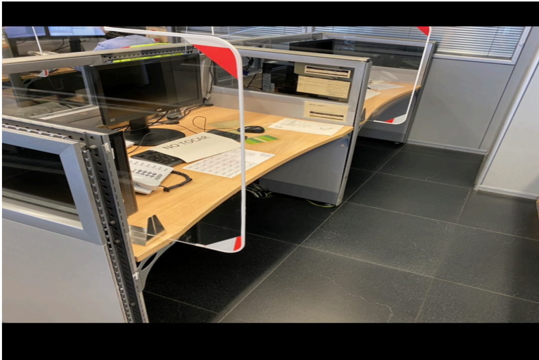
Fotografia de l'estat actual del BOX . Lloc on passa l'operador de 8 a12 hores